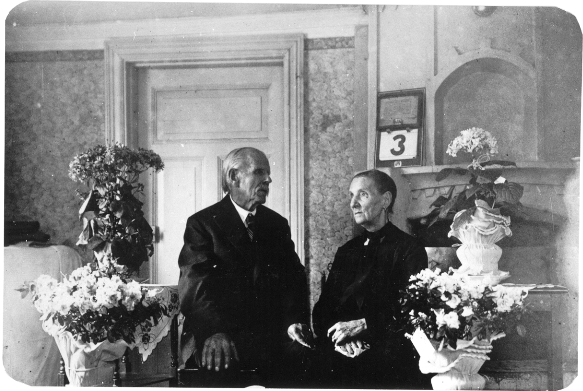
Bilden av en