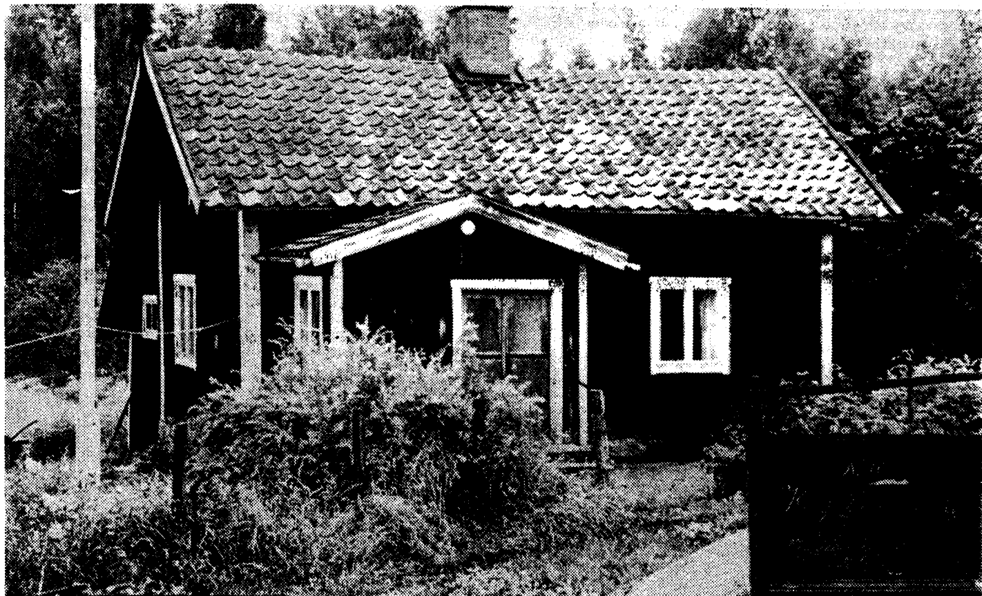
Stugan där knekten Norén bodde i vid Holmatorp finns kvar än i dag. Den enda större ändringen är den tillbyggda verandan. Infälld nummertavlan som satt på soldattorpet.